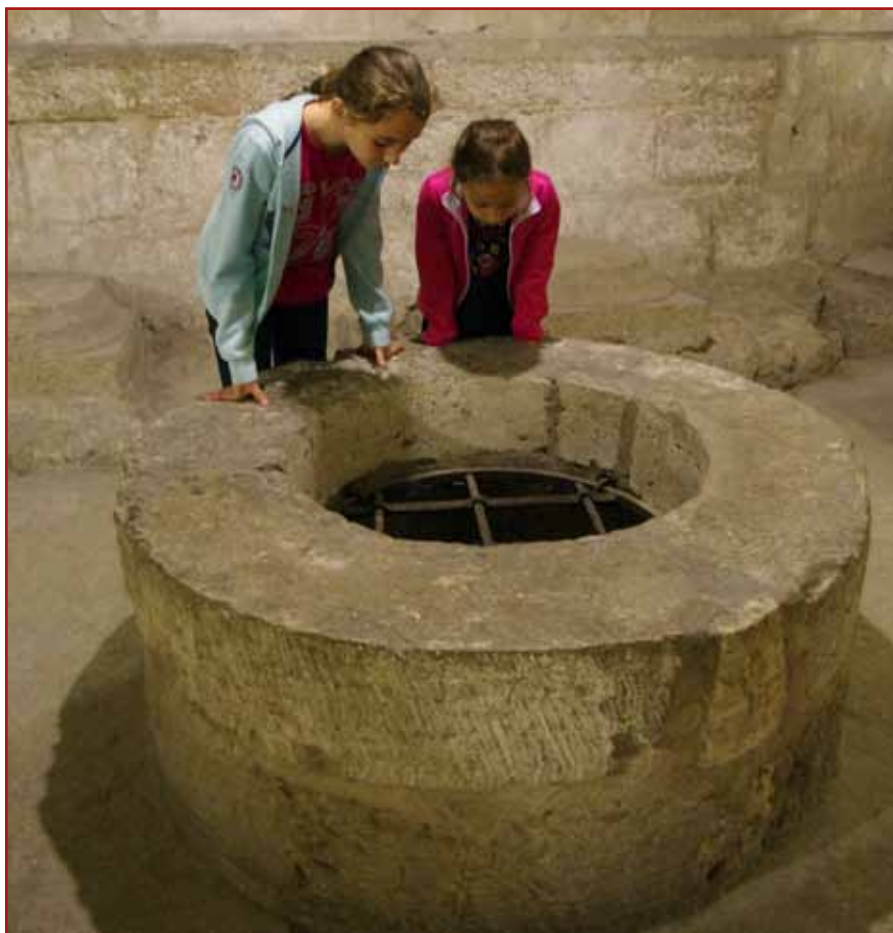
Studnia w krypcie pod katedrą w Rouen pobiera wodę ze źródła, z którego mogła również pochodzić woda do chrztu św. Olafa.

Zarówno program religijny jak i kulturalny był bogaty. Głównymi wydarzeniami były sprawowane w katedrze w Rouen ekumeniczne nabożeństwo w sobotę 18. października i uroczysta Msza św. w niedzielę 19. października. Dzięki życzliwości Redakcji St. Olav prezentujemy kilka zdjęć i informacji z tych uroczystości.