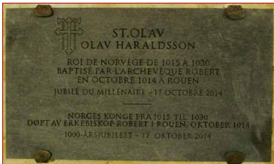
Kamienna tablica upamiętniająca św. Olafa wisi w krypcie katedry w Rouen. Została odsłonięta 18 października i jest darem konserwatora katedry Nidaros we współpracy z Kościołem katolickim i Kościołem norweskim.