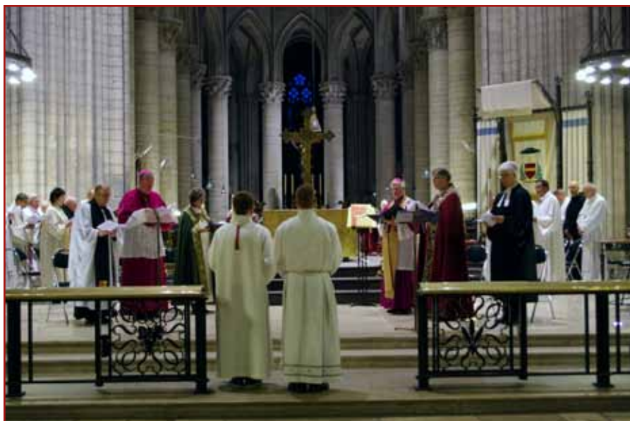
Nabożeństwo ekumeniczne z udziałem przedstawicieli Kościoła katolickiego i luterańskiego z Norwegii i Francji