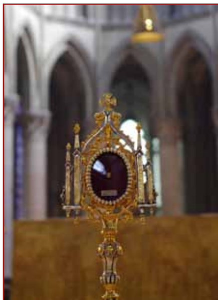
Relikwia pochodzi z ramienia św. Olafa z Oslo. Została подарowana przez bp Bernta Eidsviga dla katedry w Rouen w niedzielę 19. października.